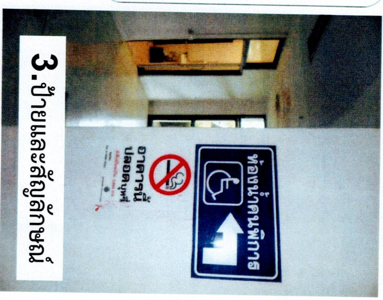
3. ป้ายและสัญลักษณ์