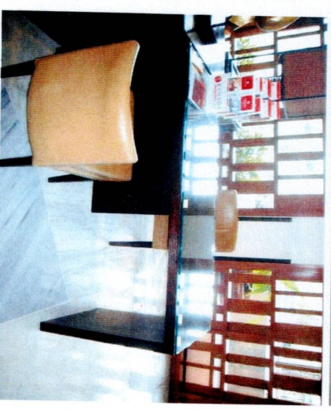
5. บริการข้อมูลข่าวสาร