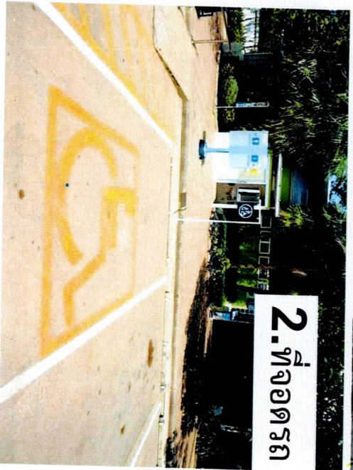
2. ที่จอดรถ